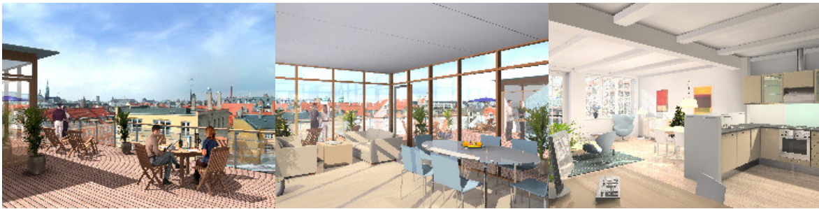
3D-visualisering af det færdige resultat. Der ses udsigten over byen fra hhv. tagterrassen og inde fra den fælles pavillon på taget. Det sidste billede viser køkken/stue, der vender mod gården.