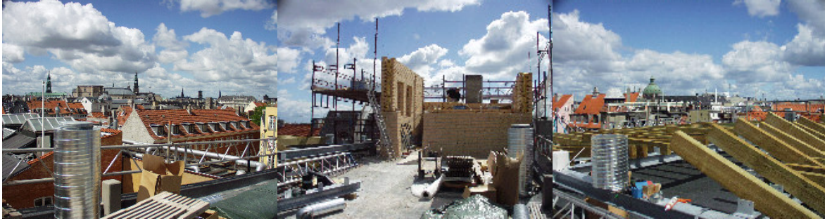
Billeder fra tagterrassen under opførelsen.