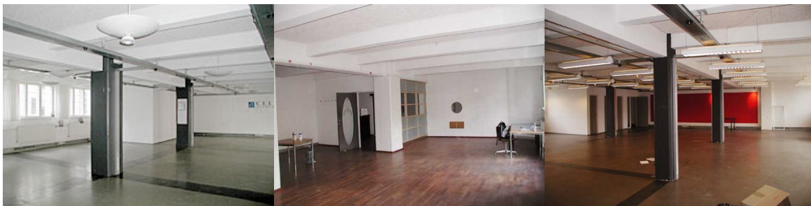
Kontorejendommen som den så ud inden ombygningen.

Foruden adgang til tagterrassen har alle lejlighederne altan på 4,5 m 2 til den ene side. Facaderne er murværk i lyse farver med enkelte mørke felter i en svag blå/grå farve. Indvendig har beboerne haft stor valgfrihed mht. indretningen, idet de blev inddraget i tiden inden ombygningen stod færdig. Overdragelsen af lejlighederne til beboerne skete i november og december 2004 og på daværende tidspunkt kunne penthouse-lejlighederne købes for 6.500.000 kr. Der er ikke bopælspligt på adressen, og derfor bebos mange af lejlighederne af udlandsdanskere.